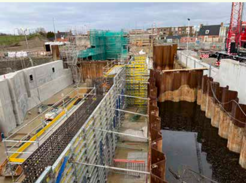
Bouw Schutsluis Zoutkamp