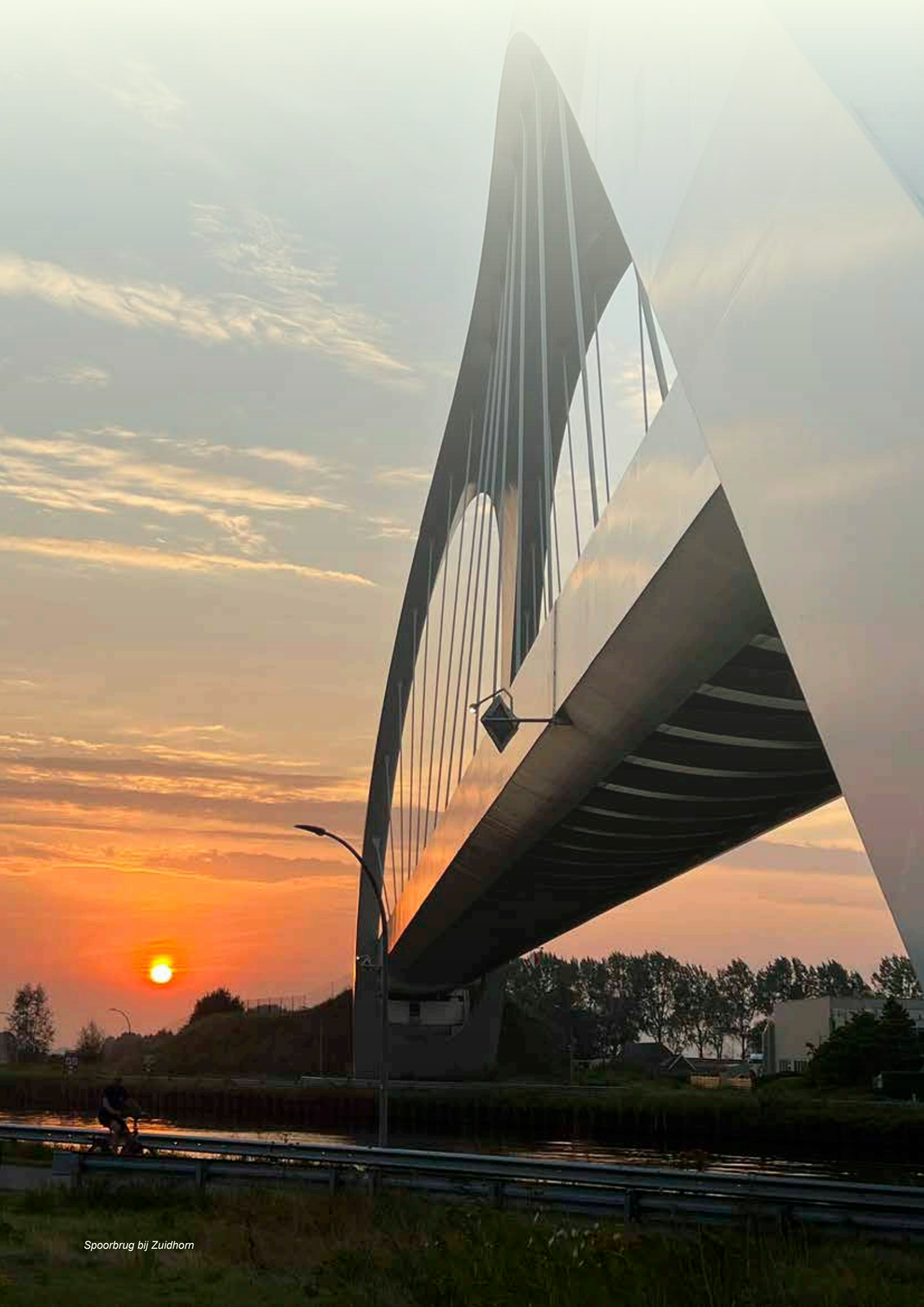
Spoorbrug bij Zuidhorn