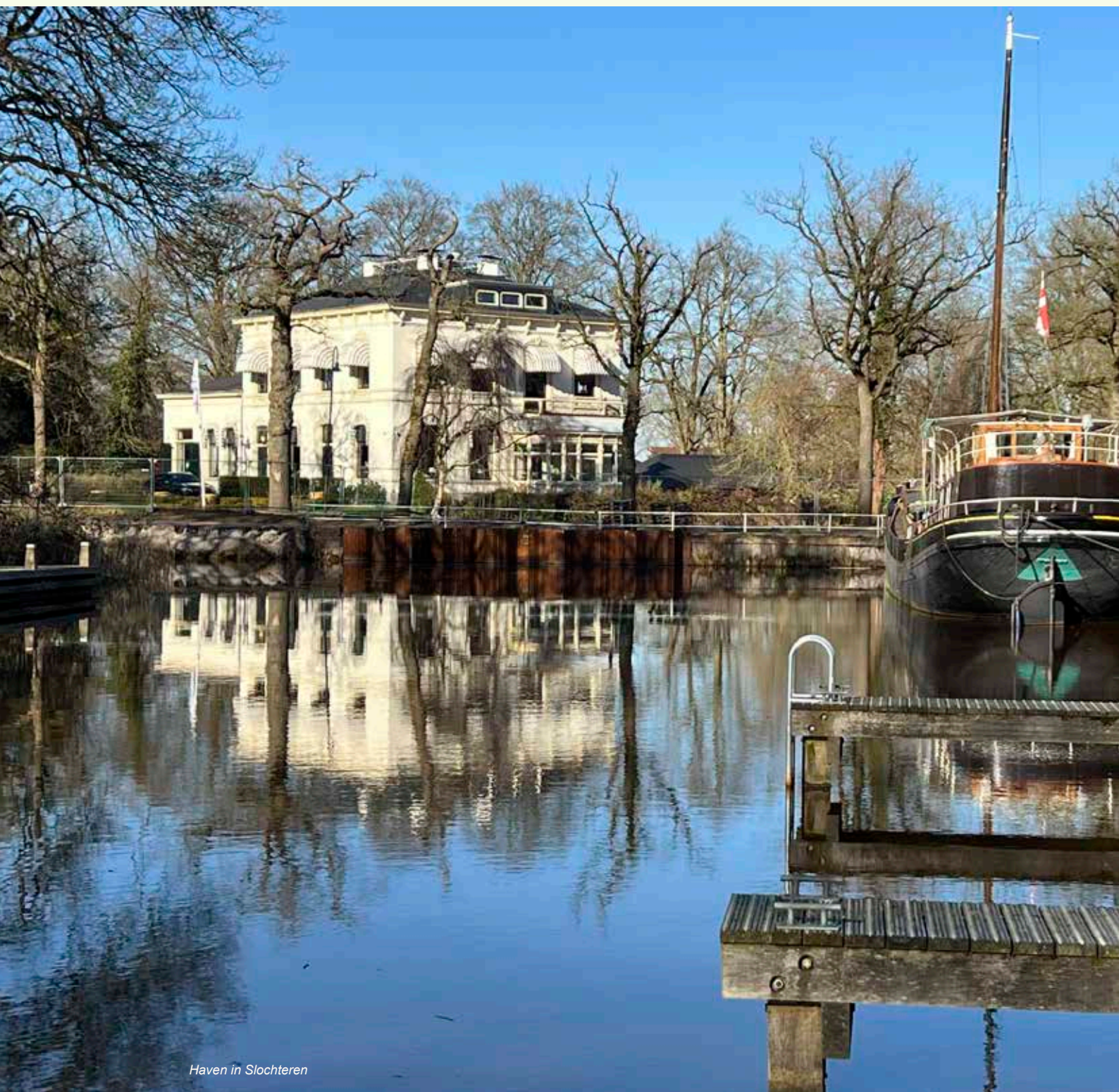
Haven in Slochteren