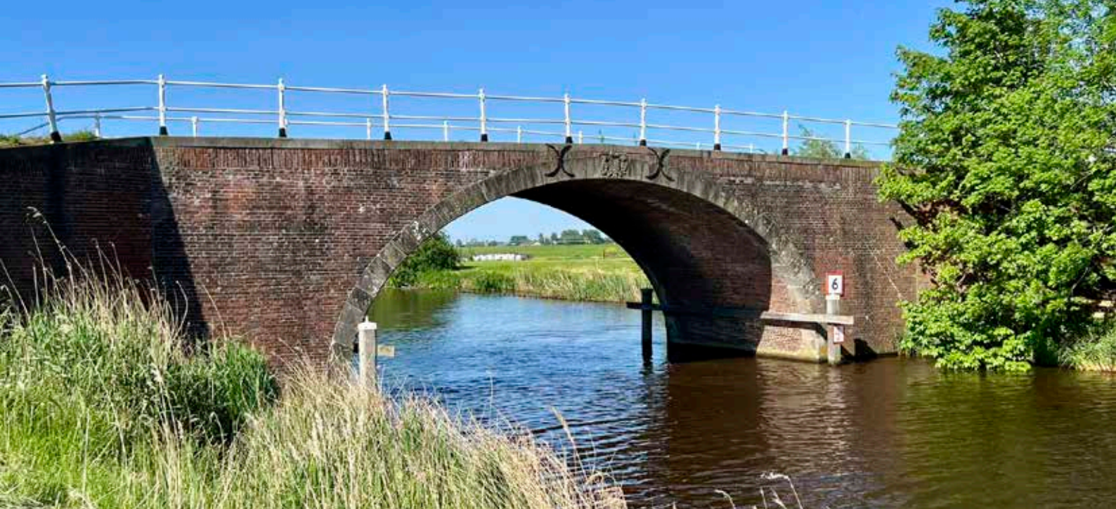
Steentilbrug over het Aduarderdiep

Besloten is uit te gaan van een disconteringspercentage van 2,2%. Het definitieve rapport is in 2016 vastgesteld. Op basis van dit rapport heeft de Commissie een definitief besluit genomen over de contante waarde van 23 bodemdalingsobjecten.