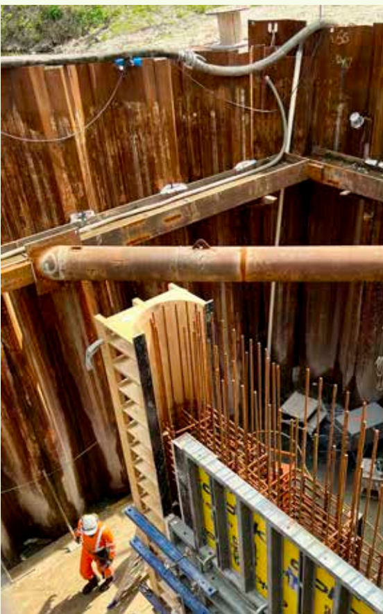
Aanleg gemaal Hunsingo

De bestaande permanente stations zijn tussen 2018 en 2020 aangevuld met 29 Integrated Geodetic Reference Stations (IGRS), die een GNSS-ontvanger (Global Navigation Satellite System, GPS) met meetpunten voor andere technieken, zoals InSAR en waterpassen, integreren. De resultaten van deze metingen worden eveneens aan SodM gerapporteerd.