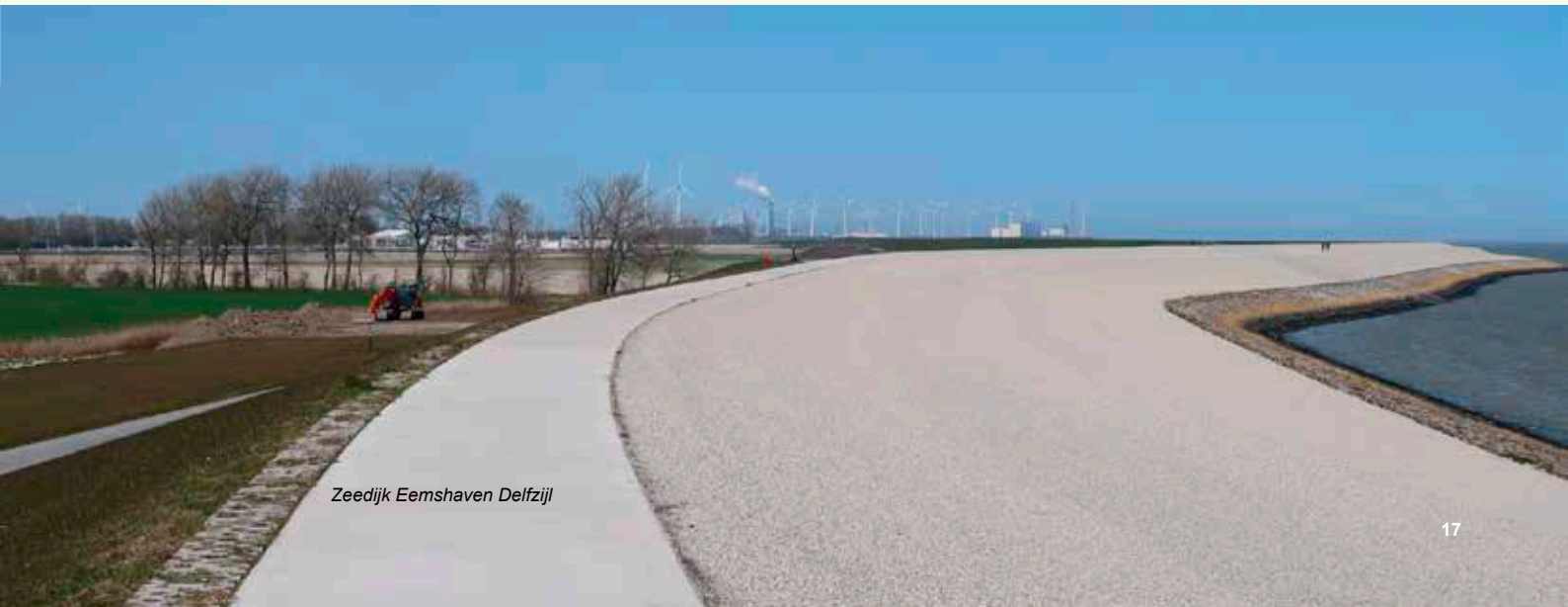
Zeedijk Eemshaven Delfzijl